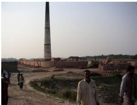
Horno de zanja gigante en India