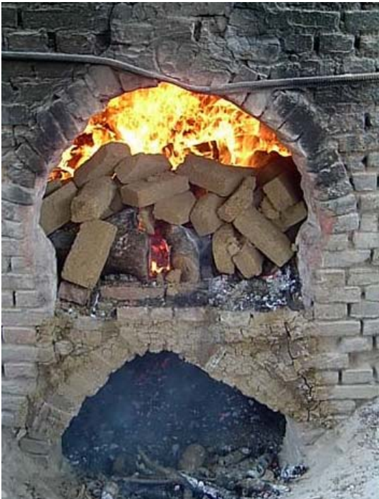
Quemando un horno de carga con Briquetas de Combustible Sólido

En la mayoría de los hornos, la leña puede ser parcial y hasta totalmente sustituida por otro combustible. Una forma atractiva es convertir el desecho en Briquetas de Combustible Sólido a través de diferentes medios. Nosotros favorecemos una tecnología de bajo costo, usando prensas sencillas operadas a mano. Las Briquetas de Combustible Sólido, fabricadas bajo condiciones controladas a partir de aserrín, cáscara de arroz, cáscara de café, paja de caña de azúcar, bagazo ú otros agrodesechos, tienen alto valor calorífico y pueden ser usadas para la quema controlada de productos de arcilla.