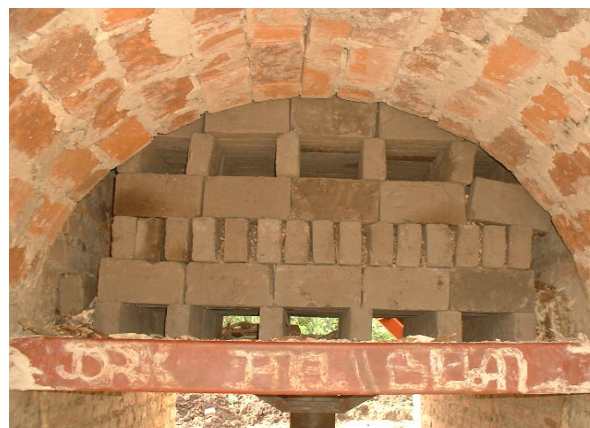
Horno vertical en Nicaragua

El Horno continuo vertical fue inventado en China hace algunas décadas y mejora la eficiencia del combustible a costos de producción similares a los del horno semicontinuo. Sin embargo, su operación requiere mayor habilidad, y hasta ahora, solo se ha probado con polvo de carbón como combustible. Una operación experimental con desechos agroindustriales está en progreso en Nicaragua.