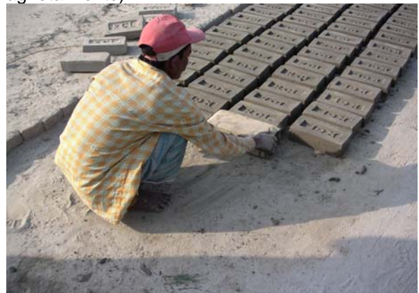
Ladrillos de arcilla moldeados en arena

Los productores mecanizados confían en el estiramiento por presión para los ladrillos. Ellos integran huecos en sus ladrillos, y así ahorran materia prima y combustible, a la vez que mejoran la calidad, pues les permite emplear arcilla de más alto grado (minimizando el agrietamiento).